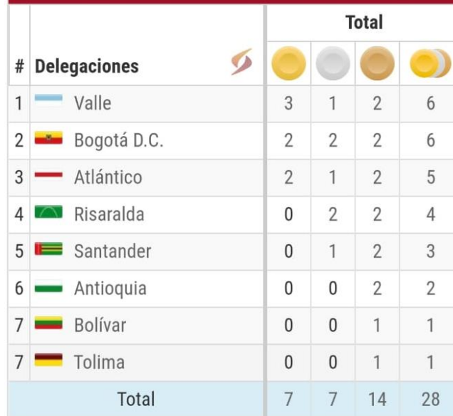
Tabla de Medallería - Delegaciones - Tenis de Campo